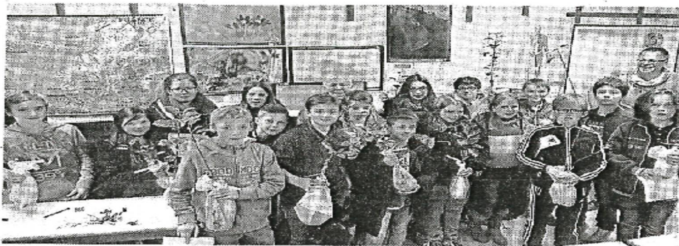
Les collégiens de 6 e ont récupéré leur arbre à planter à leur ancienne école.

Les anciens écoliers de CM2 de Jacques-Prévert, actuellement en classe de 6 e , sont revenus dans l'établissement, mardi soir, à l'occasion de la remise à chacun d'un plant d'arbres fruitiers – principalement des pommiers et quelques poiriers – parmi ceux qu'ils avaient greffés durant la dernière année scolaire.