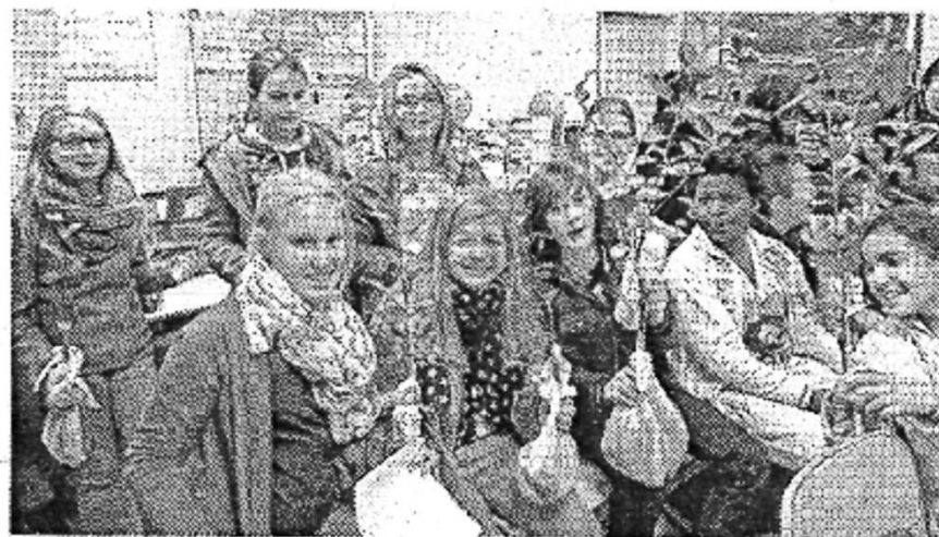
Les collégiens ont pris possession de leur pommier qui a déjà dû être replanté dans un jardin.