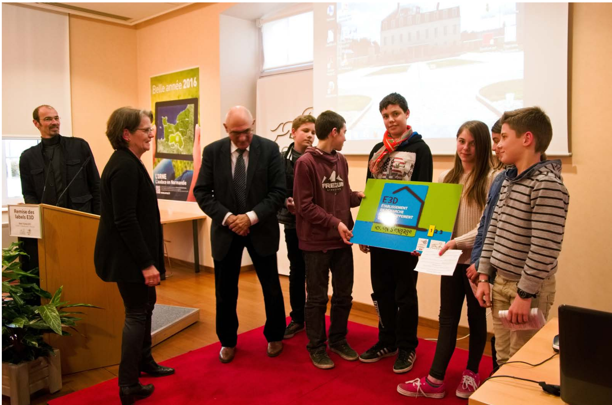
Remise de la plaque E3D