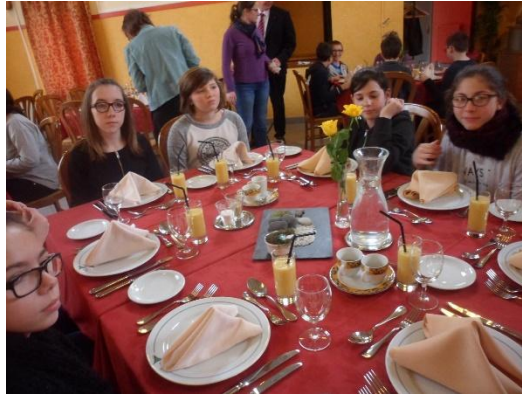
Action de sensibilisation sur le gras et le sucré en partenariat avec la ligue contre le cancer « Section de l'Orne »