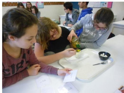
Préparation de la pâte à tartiner sans huile de palme