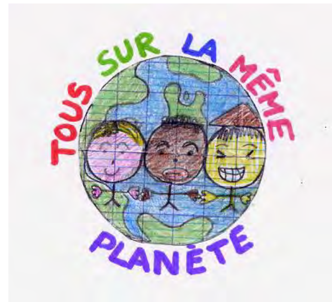
Logo du club

Un groupe d'environ 10 élèves et 1 enseignant se réunissent tous les mardis midi de 13h00 à 13h30 pour réfléchir, débattre et lancer des actions sur les thèmes des déchets et de la solidarité.