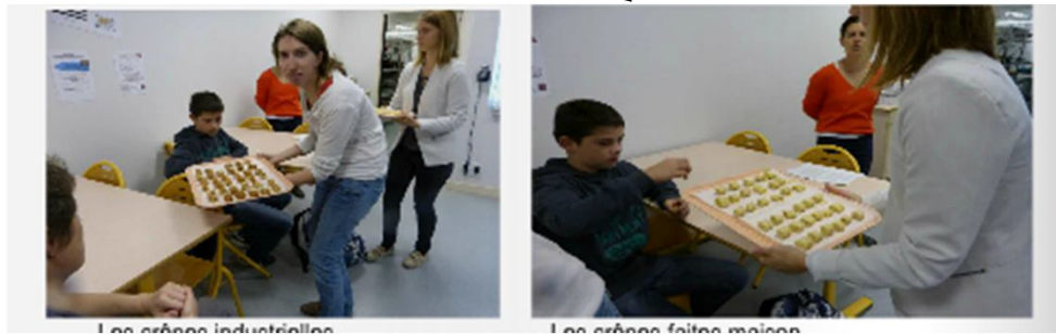
Les crêpes industrielles