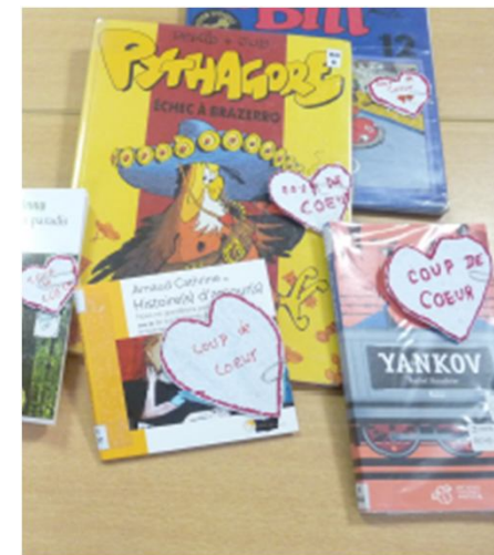
Recyclage du papier en petits coups de cœur du CDI