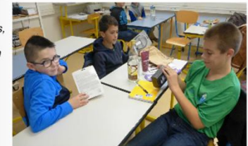
Des élèves de 6 e analysent des emballages...