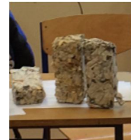
Briques de papier recyclé pour allumer le feu