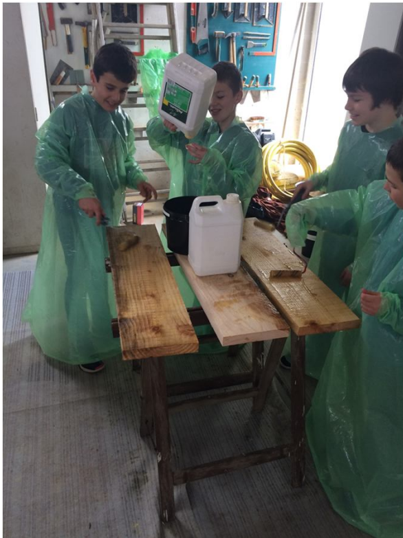
Huile de lin