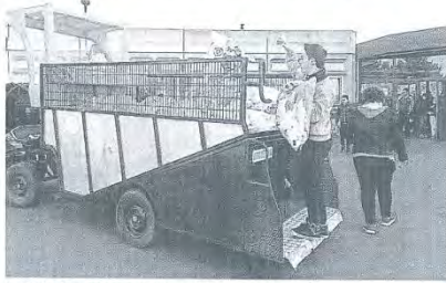
Les enfants remplissent la benne de l'hippomobile.

Chaque deuxième mercredi du mois, les élèves du collège Charles-Mozin de Trouville remettent les déchets de papiers et carton aux services du développement durable de la mairie de Trouville. L'hippomobile de la ville fait une halte et permet ainsi de récupérer les sacs jaunes et de faire découvrir les porchérons aux jeunes élèves. « Ce mois-ci, nous avons récolté 92,4 kg de déchets papiers et