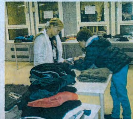
Depuis deux mois, une collecte de vêtements est organisée.

Piles, cartouches d'encre, bouchons plastiques et papier, que de déchets jetés chaque jour ! « Si les réflexes de tri sélectif ne sont pas tous acquis, l'école peut et doit impérativement jouer son rôle éducatif afin de poursuivre le travail engagé à la maison » insistent les responsables de l'opération développement durable au collège Charles Mozin, conscients de son rôle primordial dans l'éducation à la citoyenneté. Plus que faire de longs discours, le collège de Trouville a décidé de passer à l'attaque et décrété la mise en place de plusieurs chantiers citoyens. « Toutes les classes (de la 6e à la 3e) sont mises à contribution depuis la rentrée ». Si tous les élèves sont sensibilisés, les autres acteurs