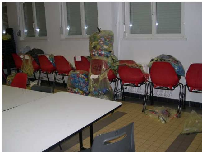
Collecte bouchons (campagne janvier 2016)