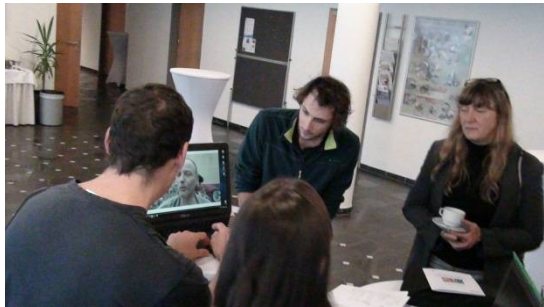
Mr Courtade explique le projet en milieu carcéral à Caen.

Et « L'art comme support d'enseignement transversal, pour le développement durable » :