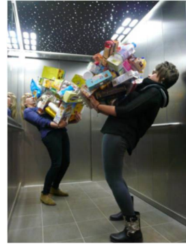
Performance des élèves dans un supermarché pour dénoncer la consommation excessive...