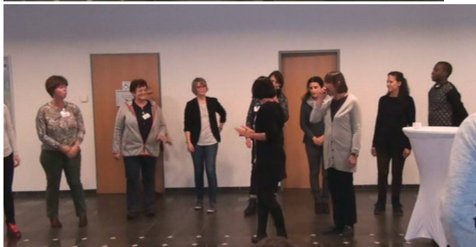
Les participants devaient trouver un geste qui symbolisait le fait de ne pas jeter des papiers au sol, par exemple..