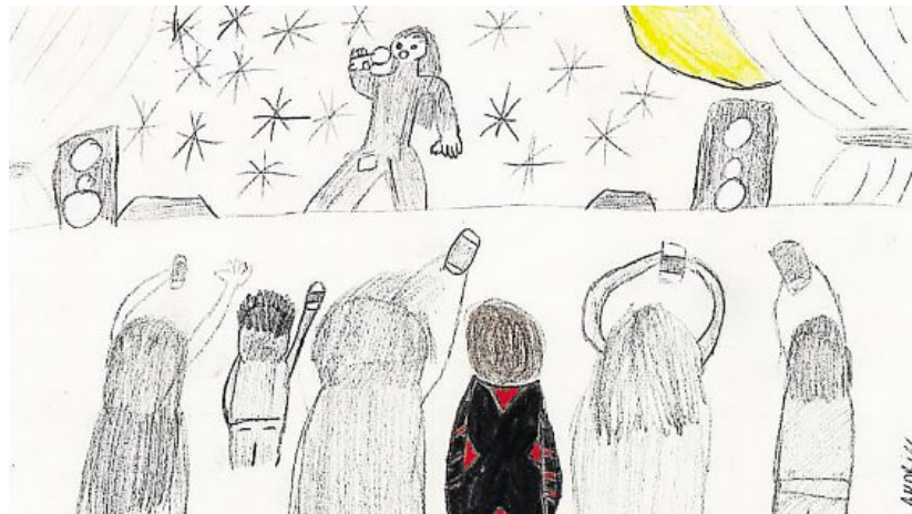
« Bonjour, je m'appelle Simon, j'ai 13 ans, je vis sans portable et je n'en veux pas. »

Vivre, à 13 ans, sans téléphone portable, est tout à fait possible, même si certains pensent que non.