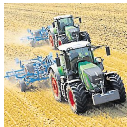
Le tracteur maître est conduit par l'agriculteur, quand le tracteur esclave est autonome.

En cas de zone blanche, des sociétés proposent une connexion par satellite. Il est aussi possible d'intégrer la fibre optique lors de la conception du bâtiment. Ces caméras apportent du confort à l'agriculteur qui n'est pas obligé de se déplacer pour surveiller pendant la nuit.