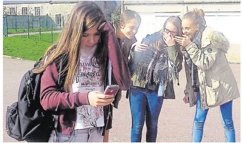
Scène fictive d'une collégienne harcelée dans une cour de récréation.