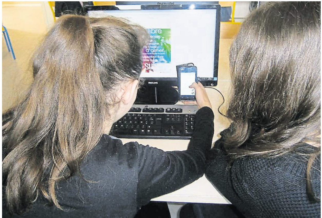
Deux collégiennes se sont projetées pour raconter la journée d'une personne hyperconnectée dans quelques années.

des volets, la température de chaque pièce, les lumières modulables selon la présence à partir de ma tablette. Il ne me reste, après cette journée, qu'à mettre à recharger mon portable et