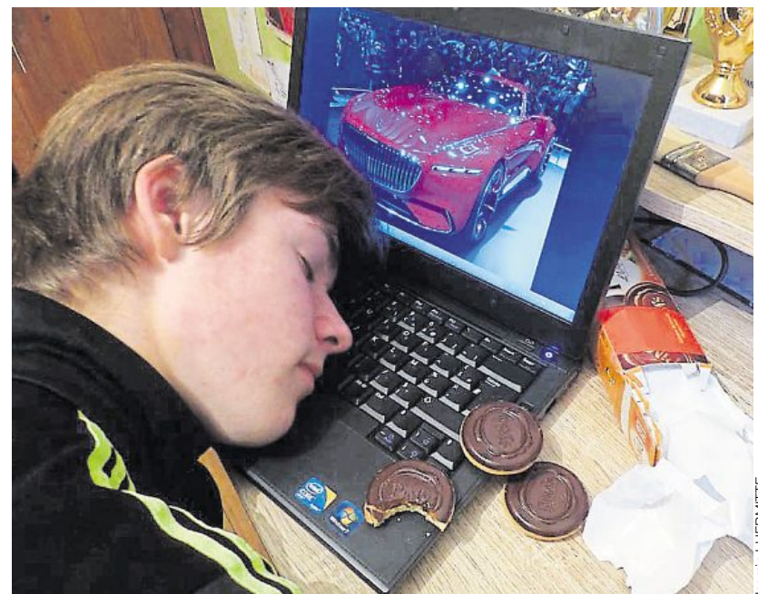
23 % des 11-12 ans interrogés, au collège Guillaume-Fouace à Saint-Vaast-la-Hougue, sont encore connectés à 22 h.

Cette phrase prouve que si le problème lié la trop grande consommation d'internet existe chez les adolescents, il est bien plus large qu'on ne