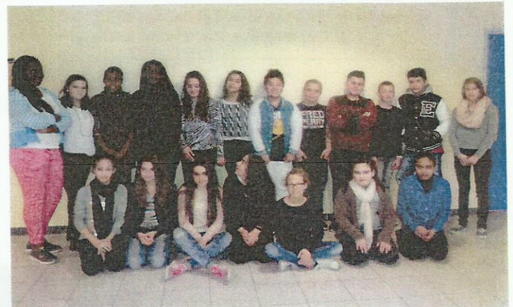
L'équipe de rédaction

Parce que Paris est le symbole de la liberté et la joie de vivre... A nous de la protéger.