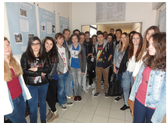
Une des deux classes ayant réalisé l'exposition (1 ère ES2)