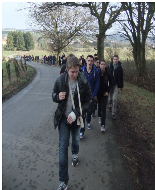
Visite des lieux de combat : les hauteurs de Ethé-Virton en Belgique.