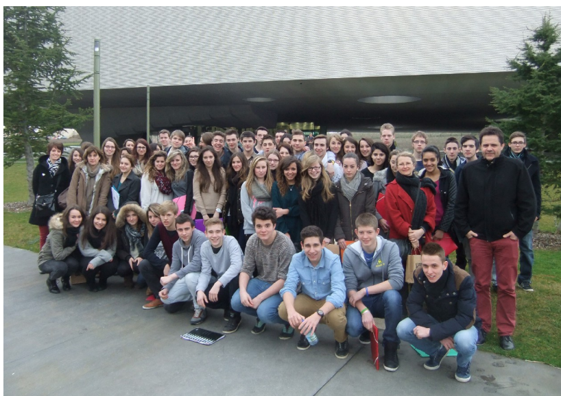
Photo de groupe devant le musée de la Grande guerre de Meaux