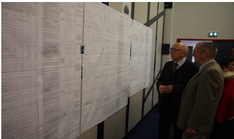
Le résultat des recherches : une liste de près de 500 soldats du 104RI tués le 22/09/1914 (liste répertoriant toutes les informations connue sur chaque soldat)

Les élèves des classes de 1ère ES et 1ère STMG ont tout d'abord effectué des recherches sur les soldats du 104 ème RI décédés à Ethe ainsi que sur les célèbres figures de Fernand Léger et d'André Mare, anciens élèves du lycée Mézeray. Leur travail a commencé par une phase de recherche précise sur l'identité des soldats à partir du site Mémoire des Hommes et des sites des archives départementales. Le résultat des recherches a ensuite nécessité un travail de dépouillement et de classement des données, le tout en étroite collaboration avec le Souvenir Français et les Anciens combattants qui ont apporté leur expertise.