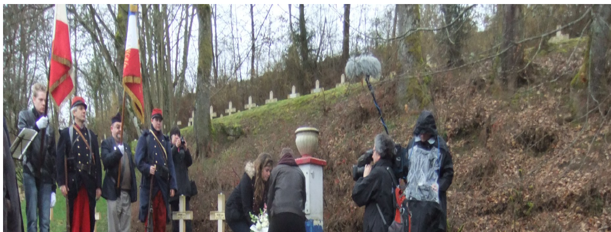
Dépôt de gerbe au cimetière de Laclaireau en Belgique.

Un voyage pédagogique sur les traces des combats de la Première Guerre mondiale a ensuite été organisé, afin de permettre aux élèves de mieux s'appropriier cette période, et rendre ainsi concrètes les recherches effectuées. Les élèves ont visité les lieux précis des combats du 22 août, ils ont rendu hommage aux soldats tués lors de la bataille d'Ethé et ils ont visité le musée de la Grande guerre de Meaux.