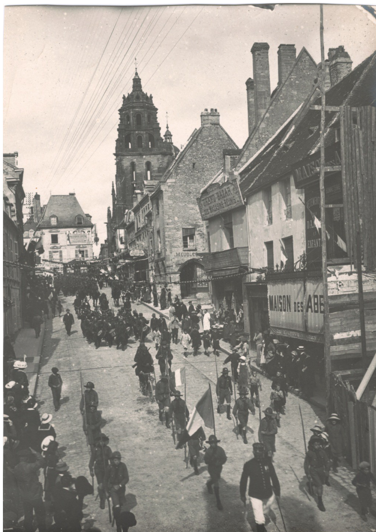
DEPART DU 104 RI LE 6 AOÛT 1914

Lycée Mézeray 6, Place Robert Dugué 61200 ARGENTAN Tel : 02 33 67 88 88