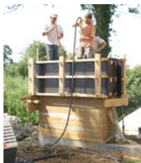
Construction d'un mur en pisé