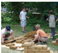
Atelier de fabrication de briques de terre crue