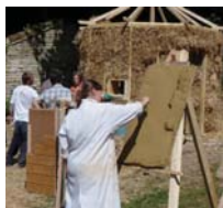
Atelier d'enduits à la terre