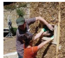
Construction d'un mur en paille