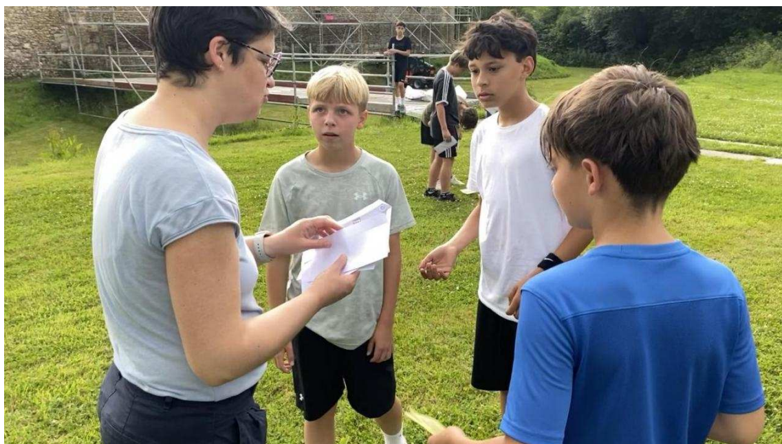
Ce projet avait pour but d'approfondir la période médiévale, une époque souvent décriée. | Paris Normandie

Les élèves ont été ravis de passer une journée médiévale au manoir du Catel et d'y jouer « Les