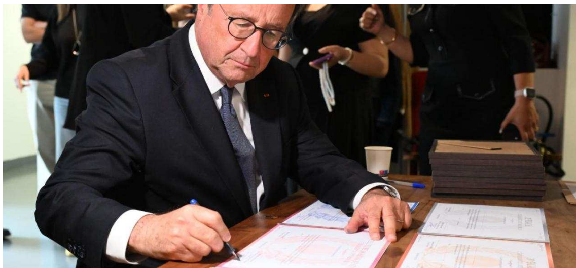
L'ancien président de la République a apposé sa signature sur le diplôme de chaque candidat.