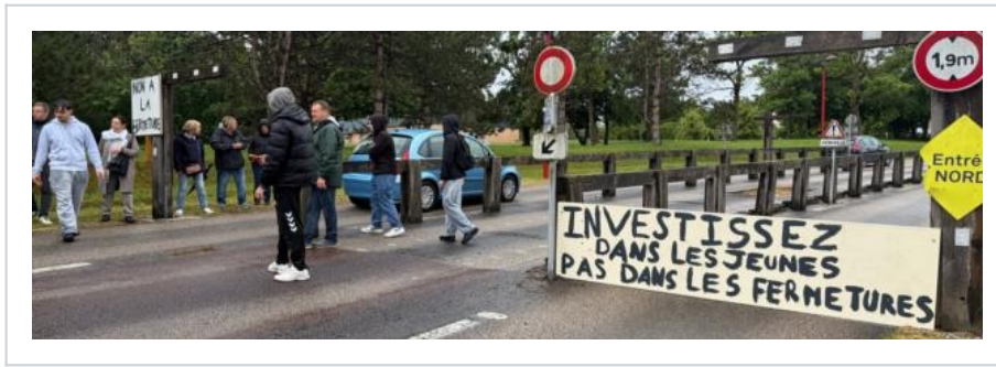
Une vingtaine de jeunes du pôle formation de l'UIMM à Alençon ont organisé un barrage filtrant pour protester contre la fermeture de leur centre de formation.