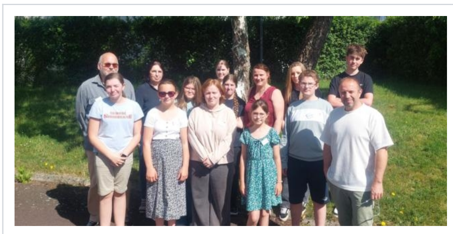
Les élèves de 4e des Cordées de la réussite avec leurs responsables.