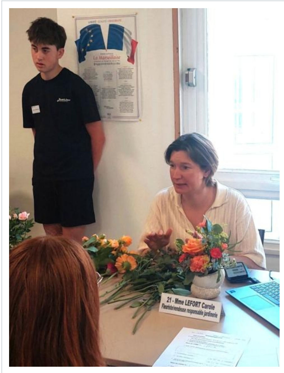
Rencontre avec une fleuriste qui a apporté des fleurs afin d'être dans le concret.