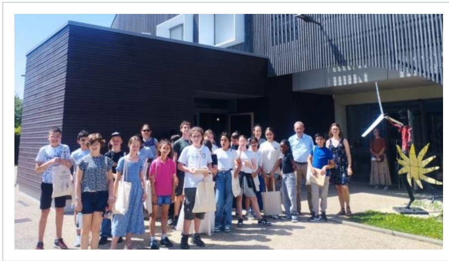
La classe de 6e F du collège Racine, lauréate du concours « Les Ecoloustics », a été récompensée par Te61.