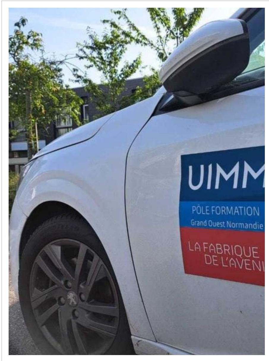
UIMM Alençon fermeture