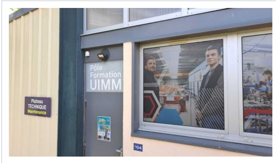
UIMM Alençon fermeture