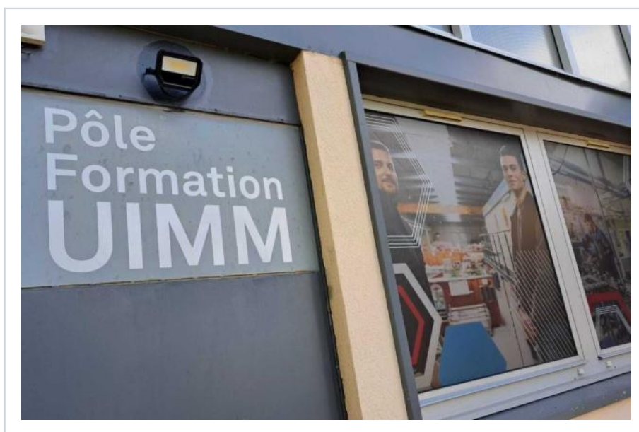
Avec la fermeture de l'UIMM, une cinquantaine de jeunes pourraient se retrouver sans formation à la rentrée.

Le président du Département et la maire d'Alençon apportent leur « plein et entier soutien aux équipes enseignantes et administratives, ainsi qu'aux apprentis des différents cursus » et promettent qu'avec « l'ensemble des partenaires, publics et privés » ils vont « continuer à se mobiliser pour conforter le développement des formations sur le site ».