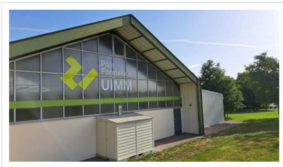
UIMM Alençon fermeture