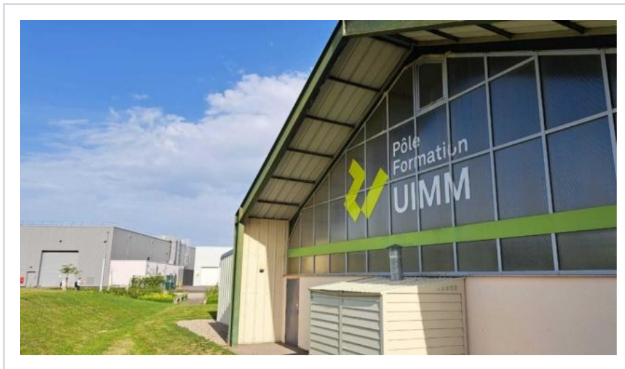
UIMM Alençon fermeture