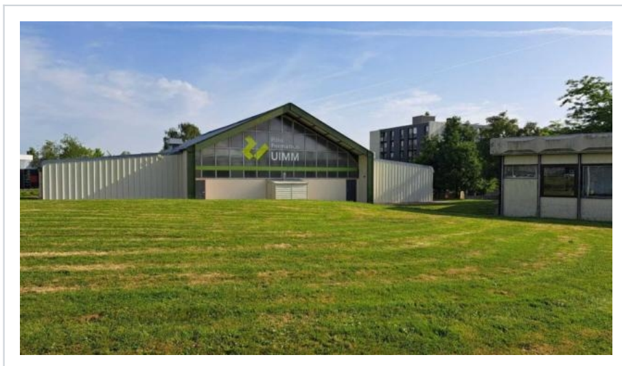
UIMM Alençon fermeture