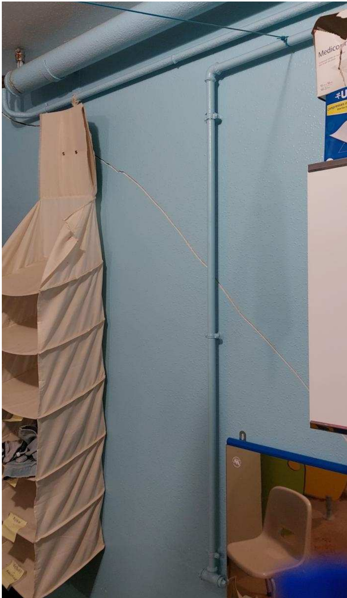
Dans les sanitaires. | F.L.