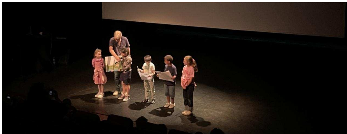
Des élèves sur scène pour lire des textes devant leurs camarades de classe.