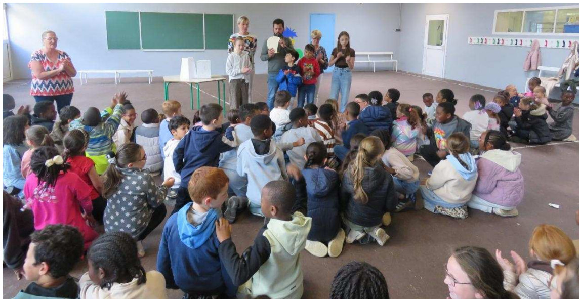
Les enfants étaient ravis de remporter le trophée. | Isabelle VILLY