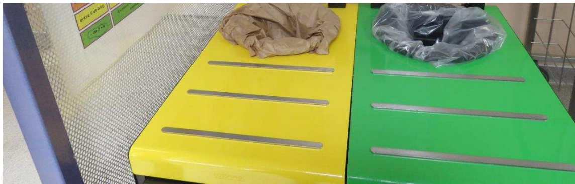
Les quatre écoles de Darnétal sont équipées de tables de tri. | Isabelle VILLY