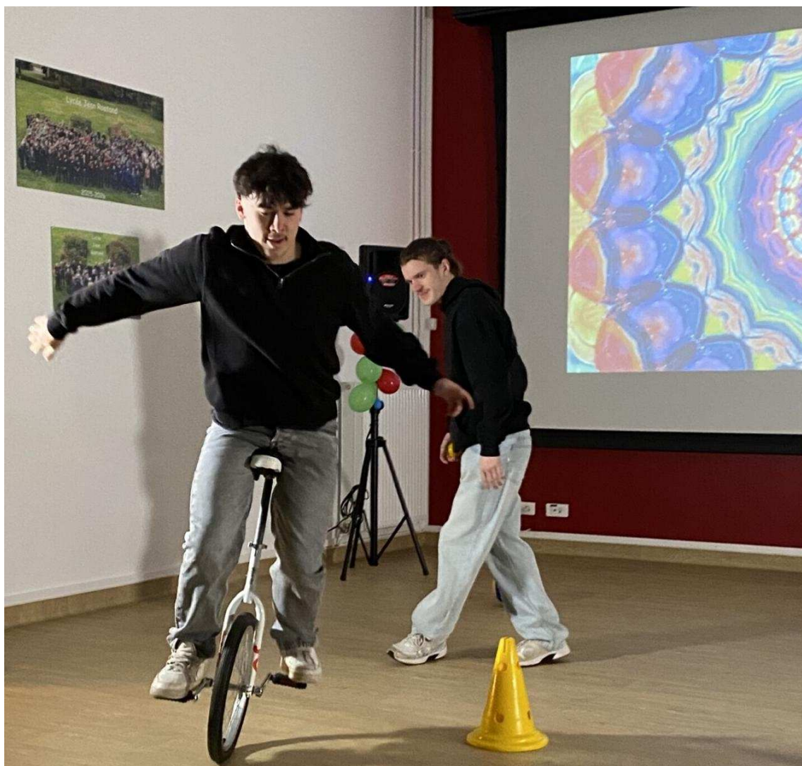
Des numéros circassiens parmi les jeunes talents | MP