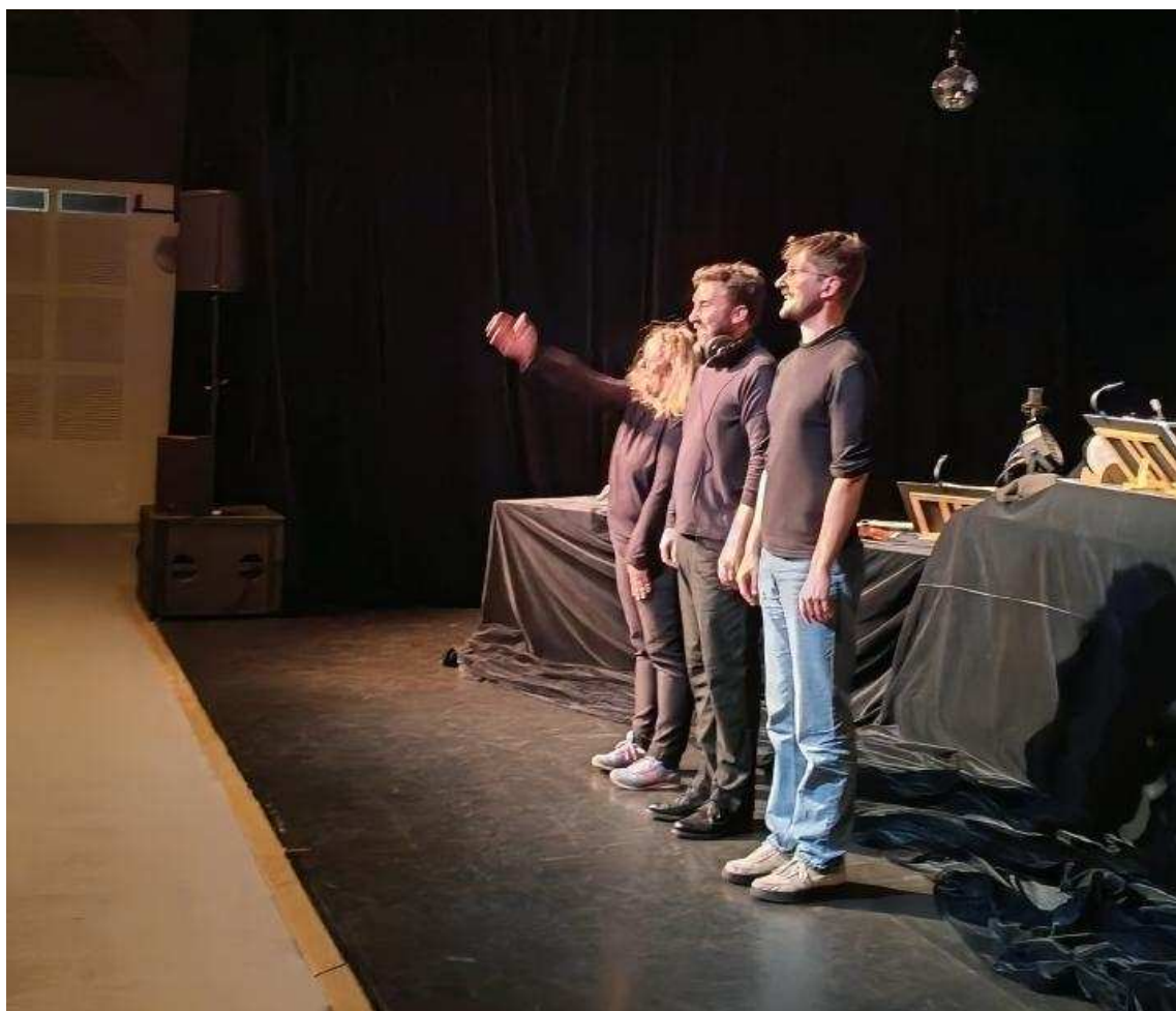
Les artistes saluent leur public.