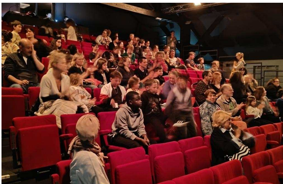
Le public avec les parents, mercredi 6 mai.