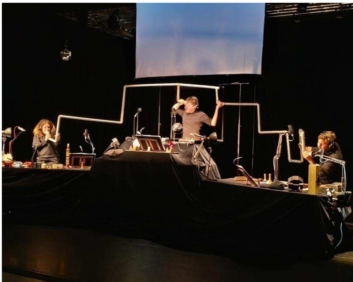
Les comédiens de la compagnie Acousmatic Théâtre sur scène.