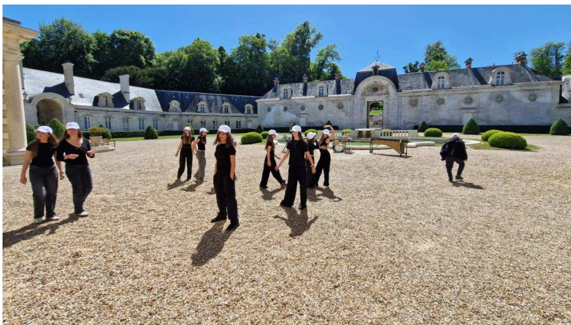
Sous la direction du réalisateur Yvan Cahagne, les élèves se sont prêtés au jeu du tournage d'un clip.