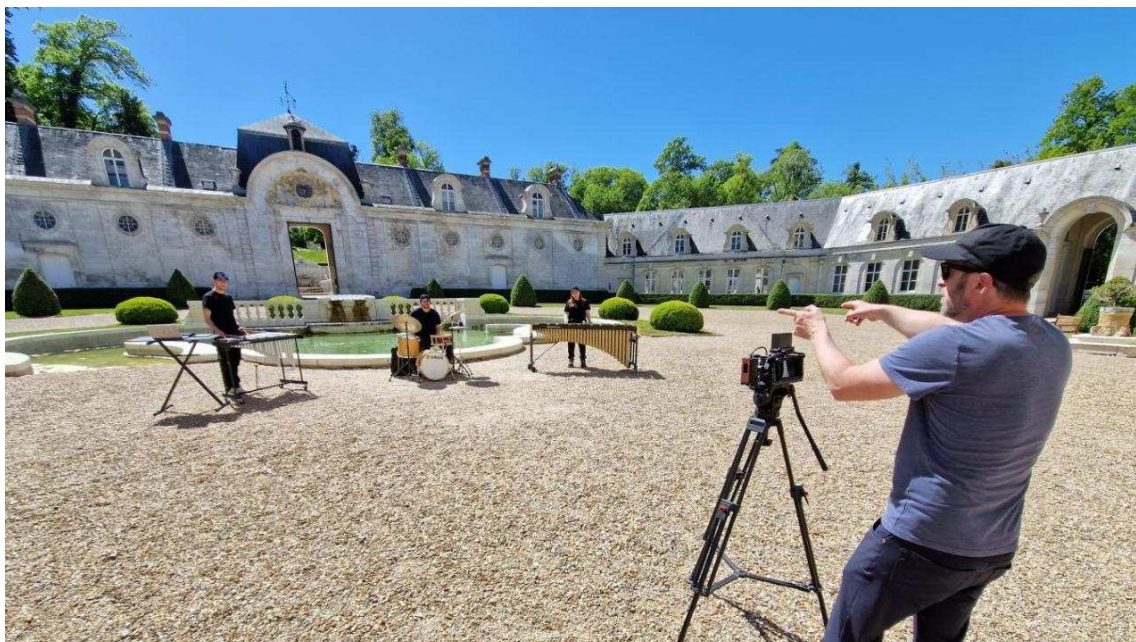
Le groupe PulsePair était à la baguette pour l'édition 2026 du programme.