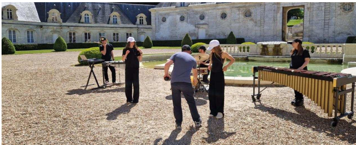
Sous la direction du réalisateur Yvan Cahagne, les élèves se sont prêtés au jeu du tournage d'un clip.