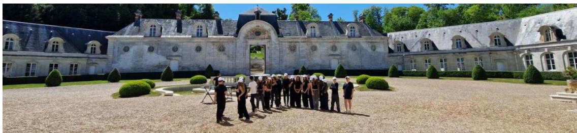
Des plans du clip ont été réalisés au drone.