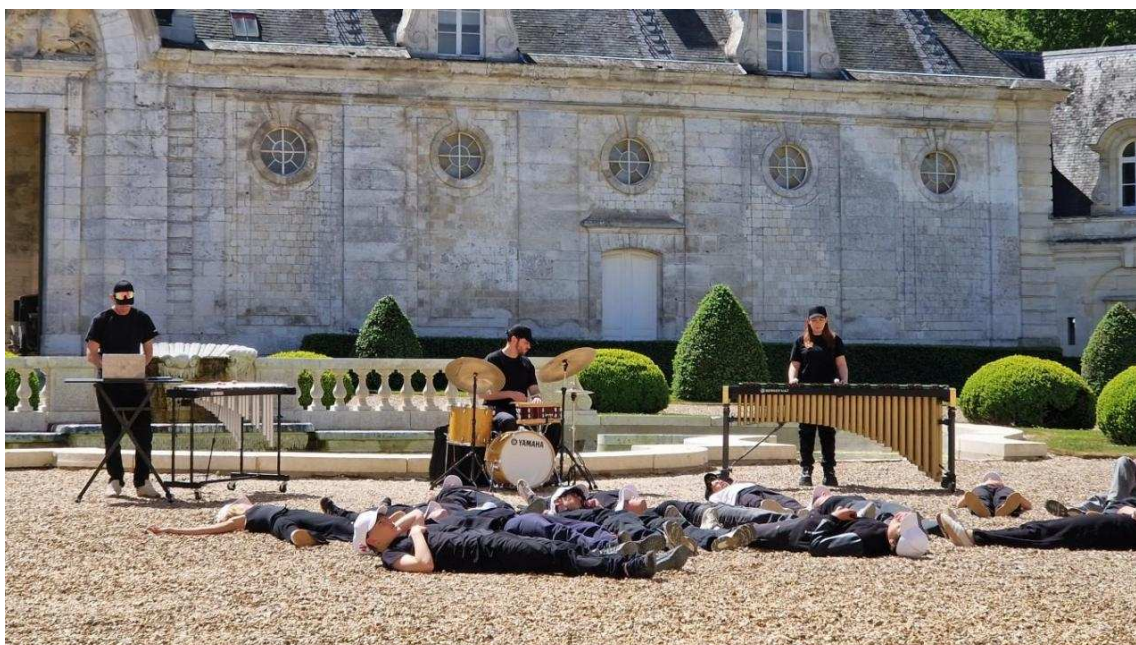
Sous la direction du réalisateur Yvan Cahagne, les élèves se sont prêtés au jeu du tournage d'un clip.