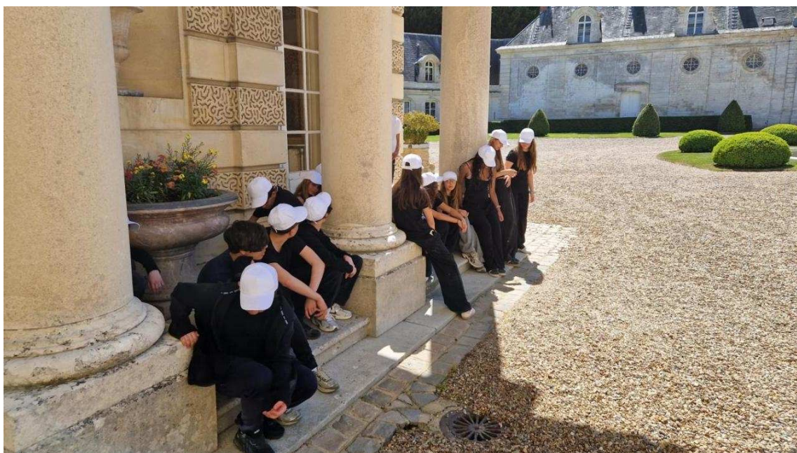
Sous la direction du réalisateur Yvan Cahagne, les élèves se sont prêtés au jeu du tournage d'un clip.