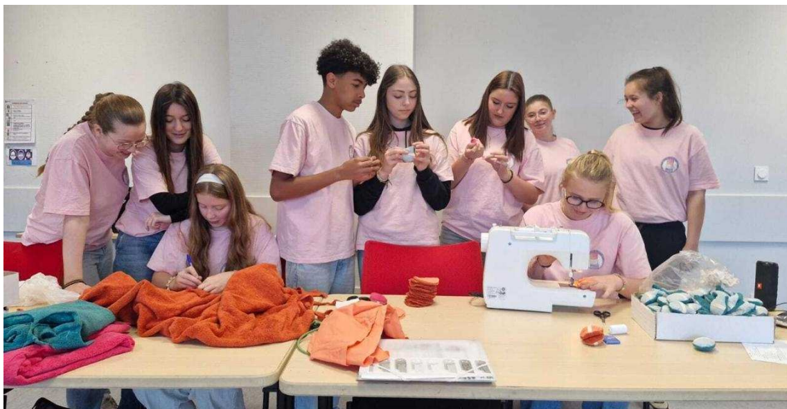
Au sein de la mini-entreprise du collège Marie-Curie, chacun a une fonction clairement identifiée.