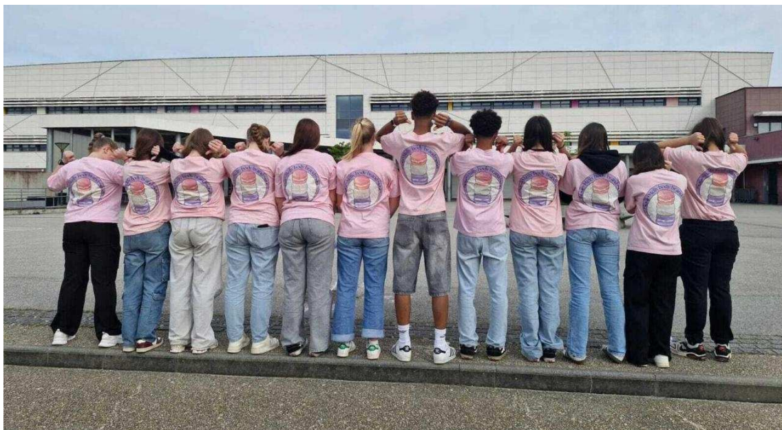
Les collégiens revêtus de tee-shirts à l'effigie de leur entreprise. | Ingrid Serck