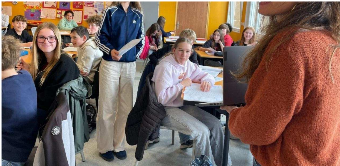
Les collégiens de Zola et leur enseignante d'espagnol très heureux d'échanger avec des élèves à l'autre bout du monde.