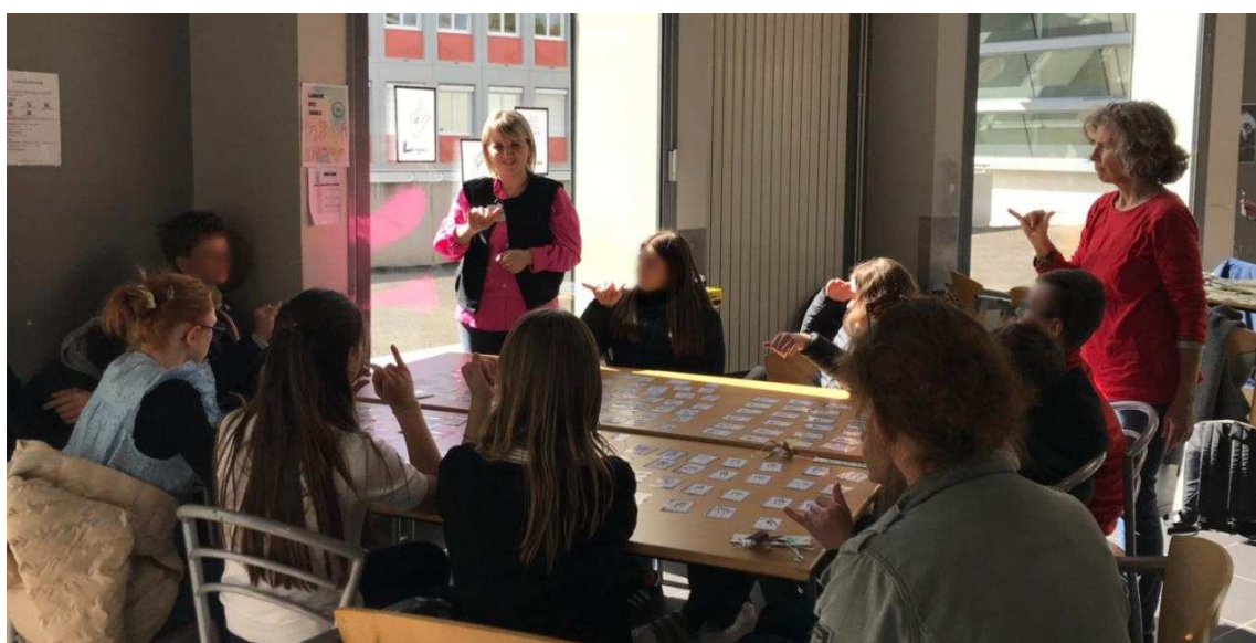
Atelier autour de la langue des signes.