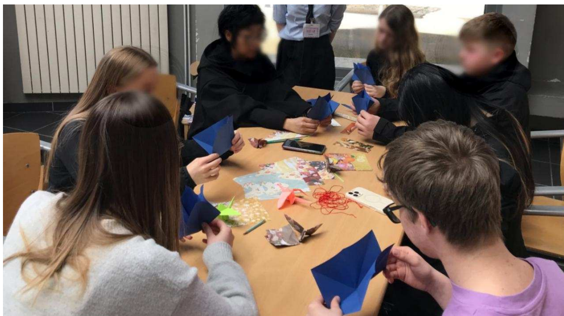
Le chinois, c'est aussi l'art de l'origami.