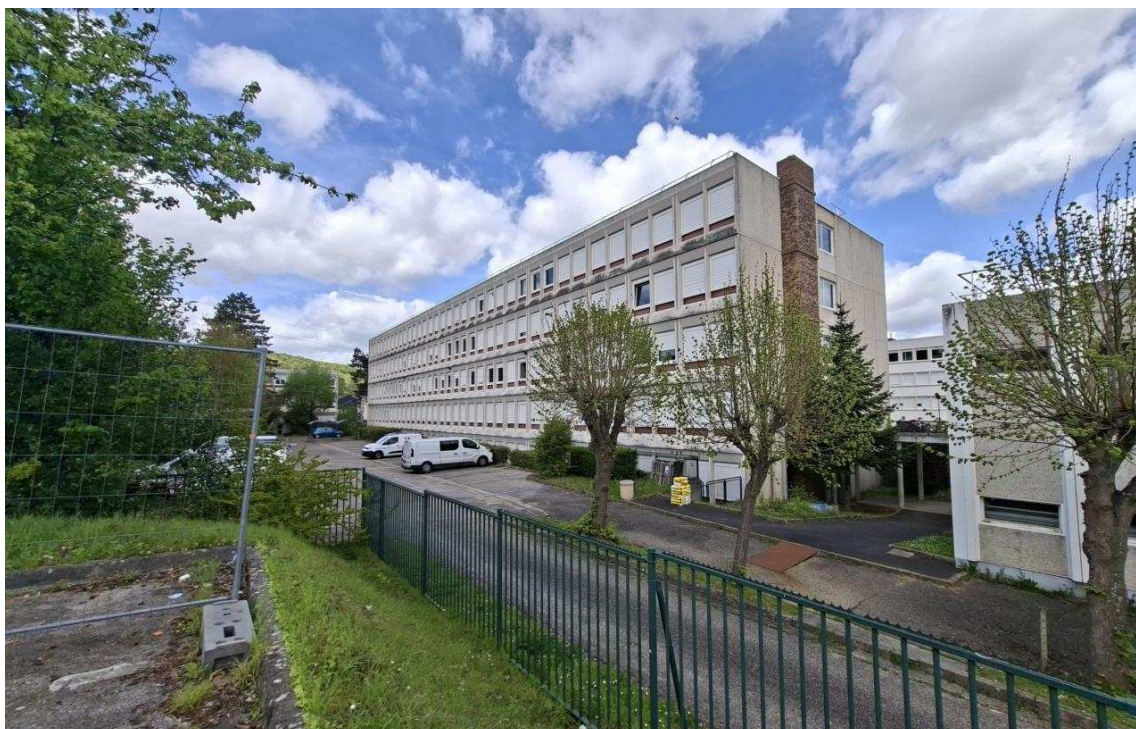
Un chantier qui doit durer jusqu'à la fin de l'année scolaire vient de débiter au lycée Ferdinand-Buisson d'Elbeuf.