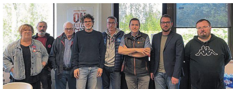
Les représentants des différents syndicats du Calvados appellent les salariés à se mobiliser le 1 er Mai.