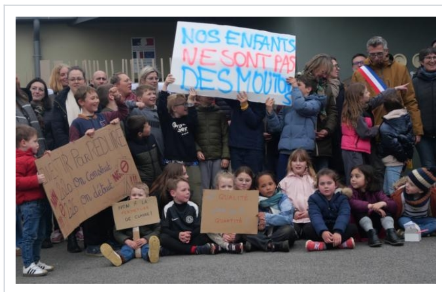
Mardi 31 mars, à 18 h, parents et enfants étaient présents à la manifestation devant l'école. Durant la journée, le corps enseignant était en grève.