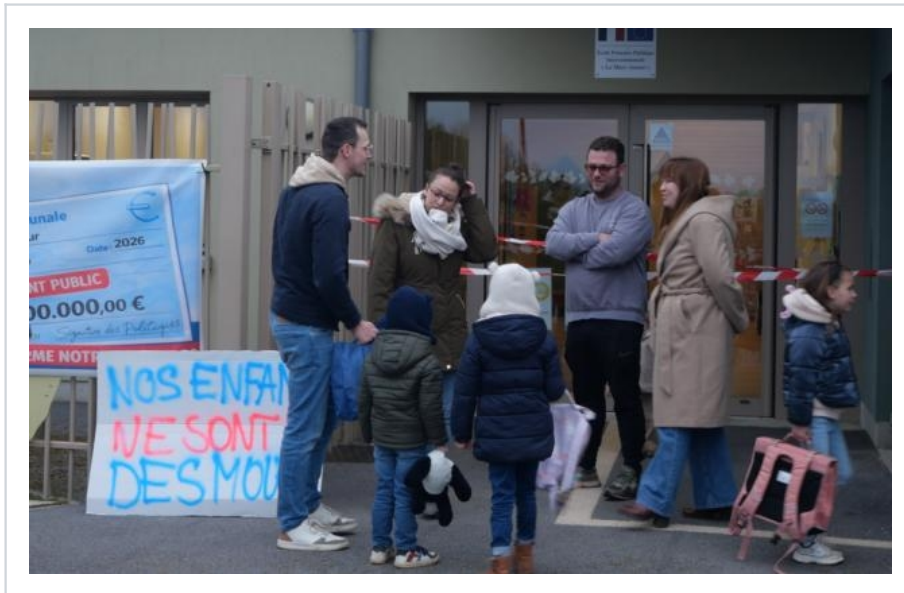
Vendredi 3 avril : action de la dernière chance. Les parents ont bloqué l'école pour interpellier l'inspecteur académique et demander un rendez-vous avant la publication de la carte scolaire. Opération réussie.