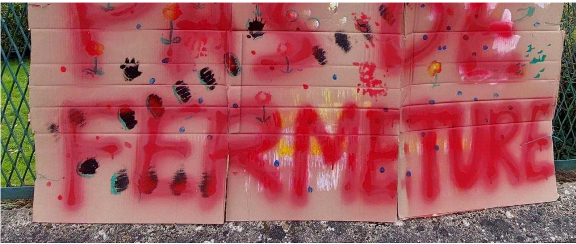
Deux pancartes ont été déposées devant l'école maternelle Galleron pour s'opposer au projet de fermeture