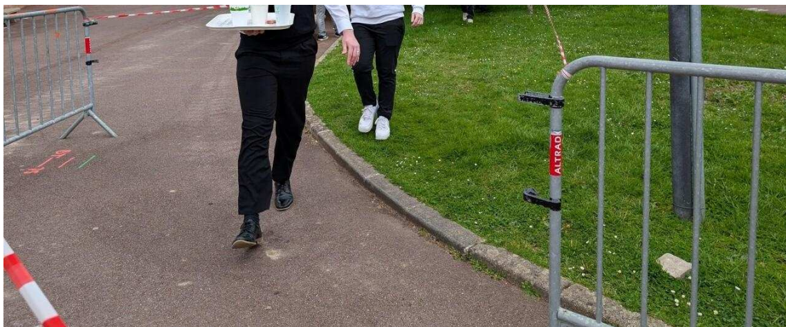
Dernier virage avant l'arrivée.