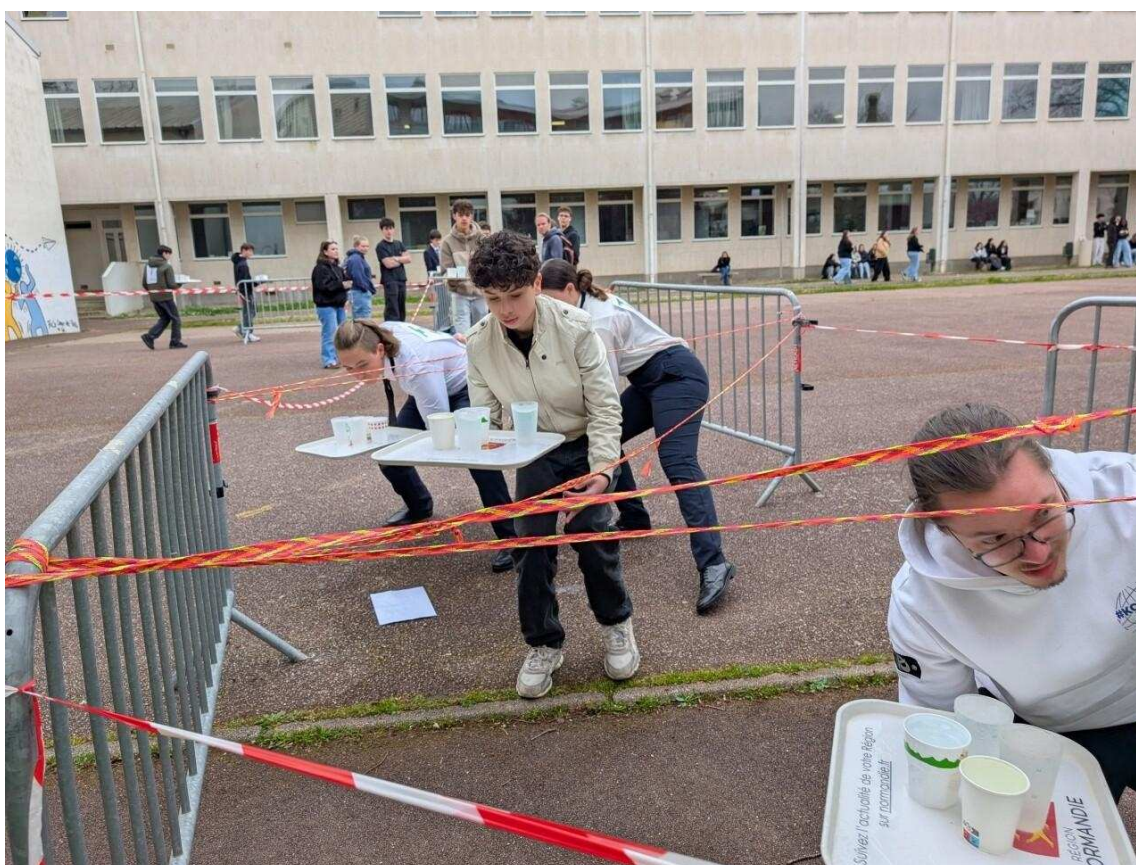
Les élèves du lycée à l'assaut d'un parcours truffé de pièges.