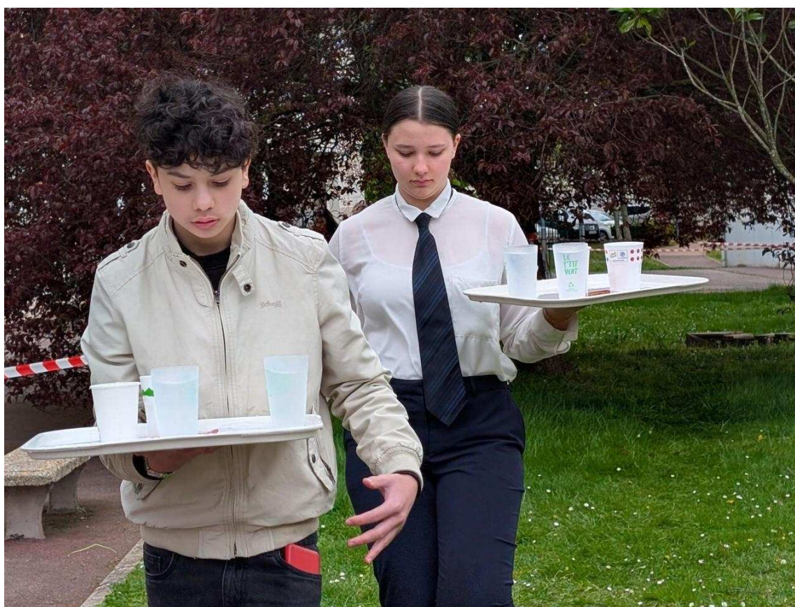
Les élèves concentrés pour éviter de faire tomber les verres.