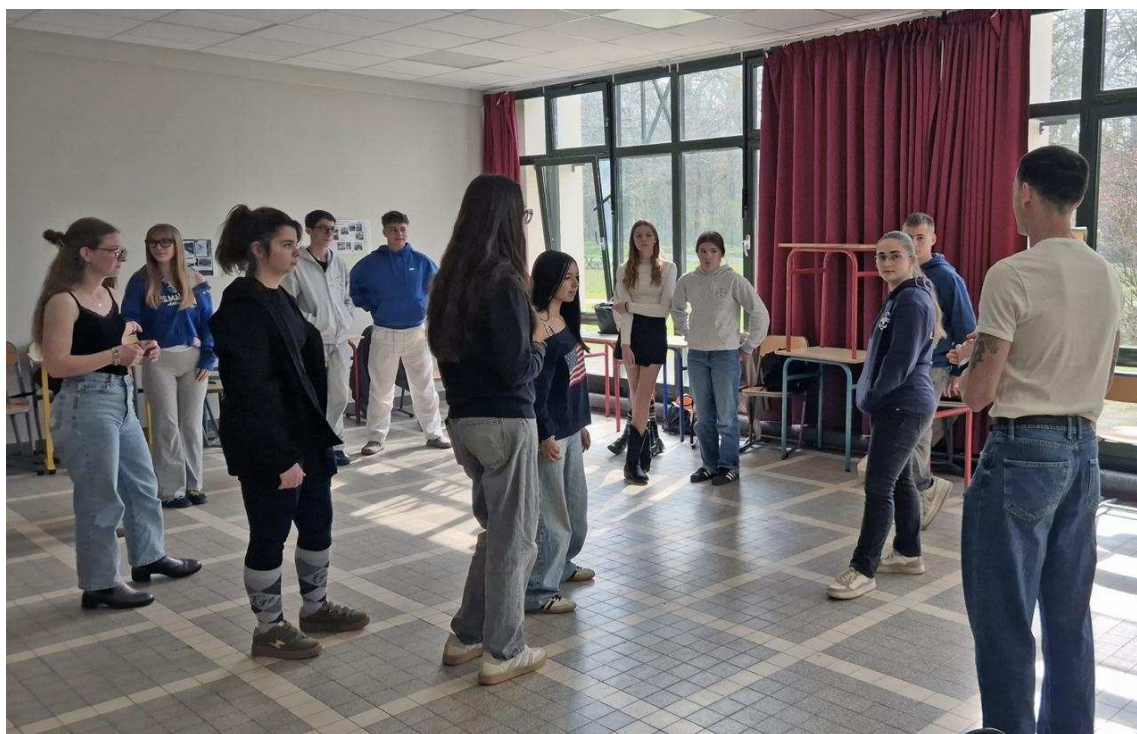
Atelier de jeu dramatique. | EPLEFPA Le Robillard.

ils pas mensonges, arrangements avec nous-même et les autres, désir d'être autres. Ne sont-ils pas en réalité totalement virtuels ?"