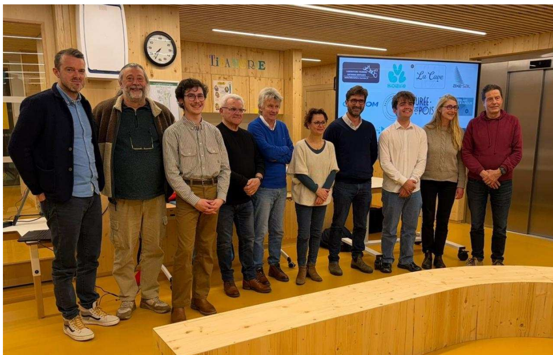
Des remerciements ont été adressés aux partenaires d'Ethan Villain.