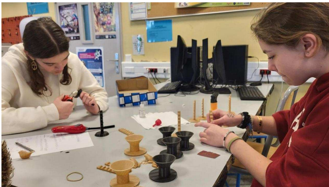
Le pôle production s'active pour présenter les oyas à la foire de Rouen . | Paris Normandie