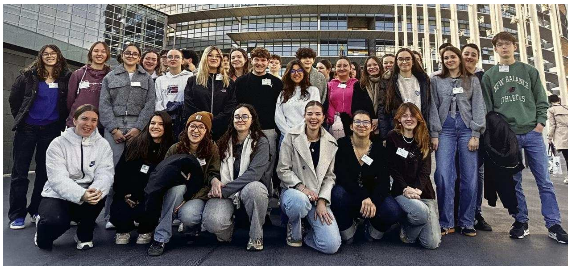
Les élèves devant le Parlement européen de Strasbourg où ils ont pu assister à une session parlementaire.

Les panneaux de l'exposition seront présentés au lycée pendant environ un mois, avant d'être exposés dans plusieurs lieux de la ville d' Argentan , afin de permettre au public local de découvrir ce travail réalisé par les élèves.