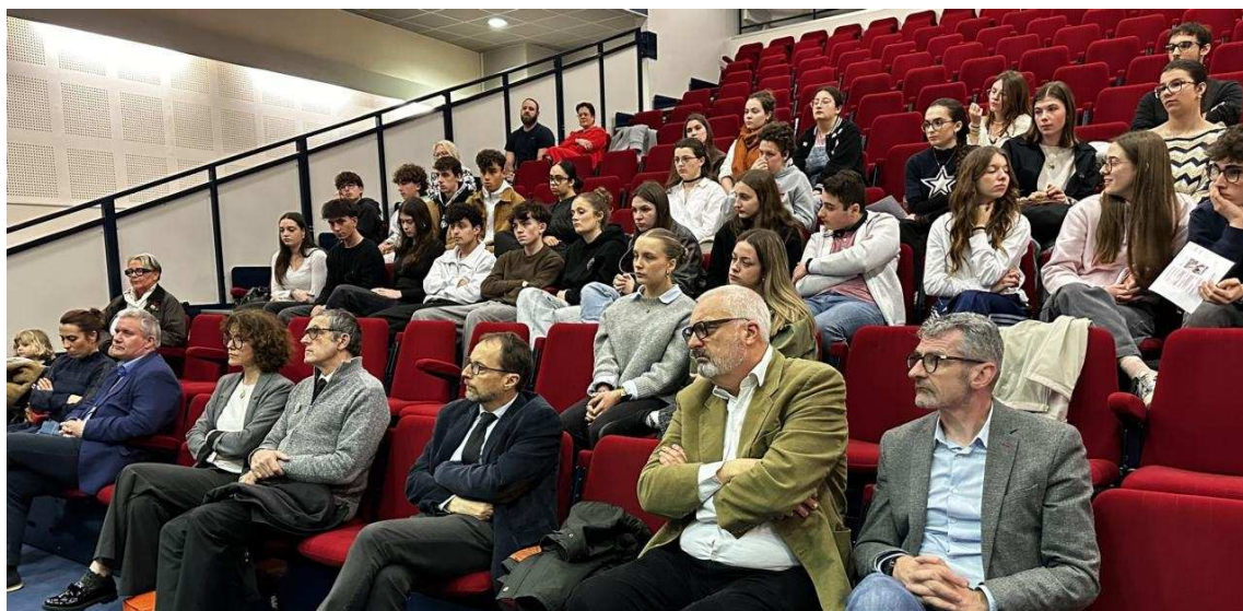
Étudiants, membres d'associations mémorielles et représentants municipaux étaient présents lors du vernissage de l'exposition au lycée Mézeray .