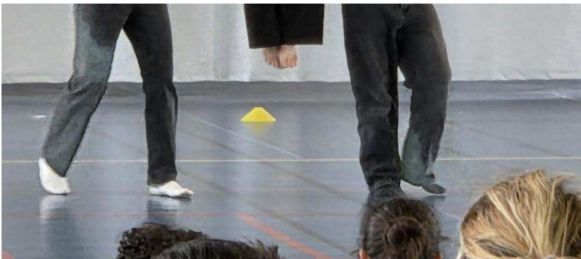
Une quinzaine de numéros se sont enchaînés.