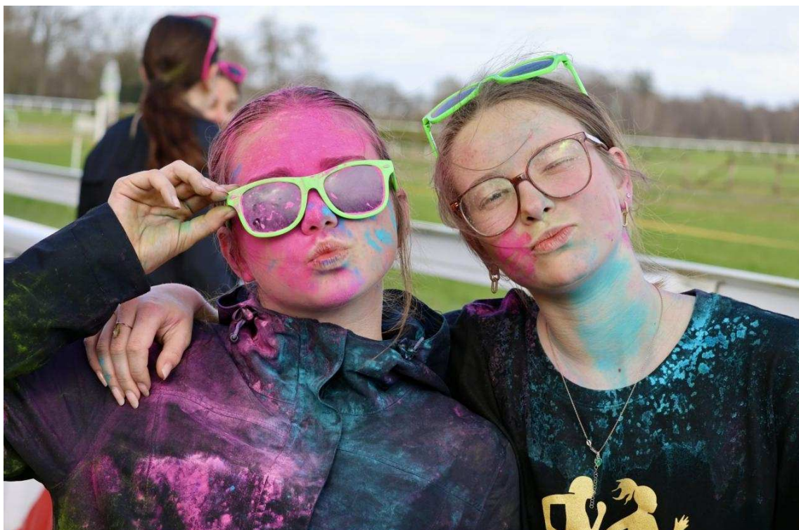
Les couleurs de la Color Run illuminaient les visages.