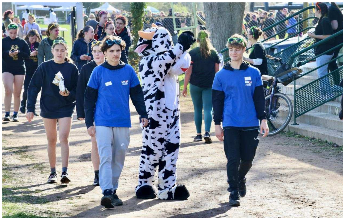
La mascotte a posé pour des photos avec les participantes.