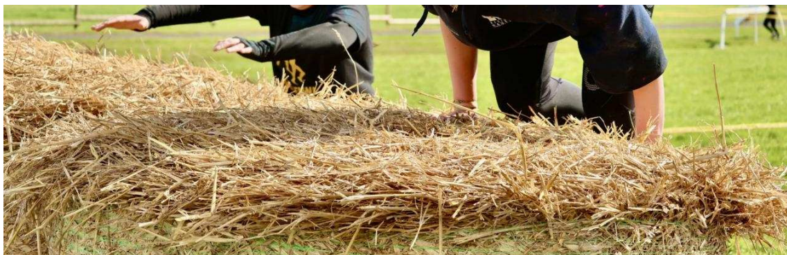
Plusieurs obstacles étaient installés sur le parcours.