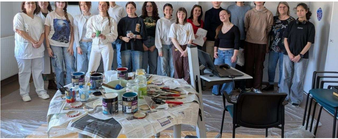
Les élèves ont été reçus mercredi dans l'unité.