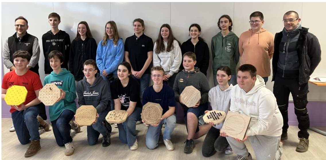
Les élèves volontaires de la classe entreprise du collège

La clôture de cette initiative est prévue pour le mois de juin, lors d'une nouvelle assemblée générale.