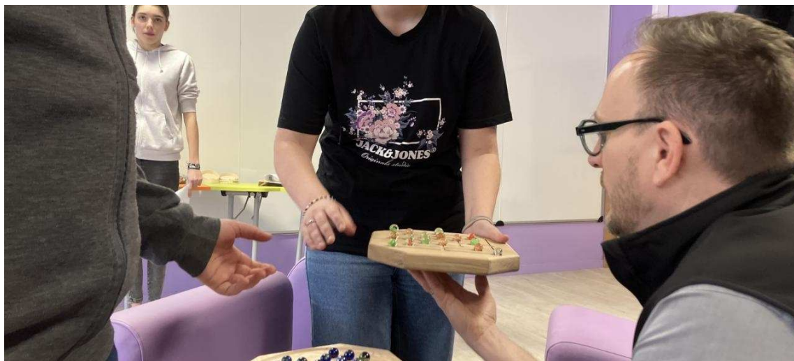
Présentation du plateau double faces