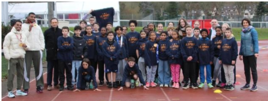
En compagnie des deux champions et de leurs encadrants, les élèves de la section sportive athlétisme du collège de Navarre avaient revêtu leurs nouveaux sweat-shirts, offerts par le Département.