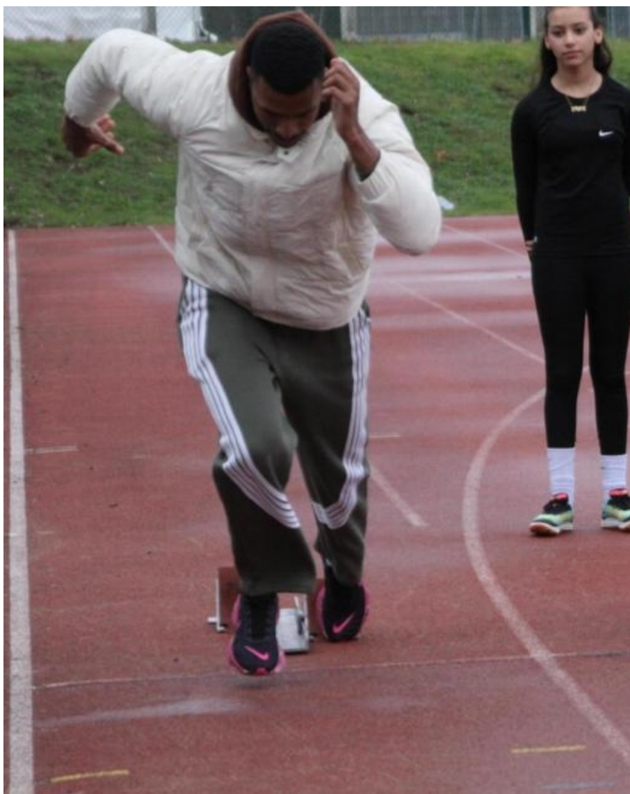
Moncef Bouga.