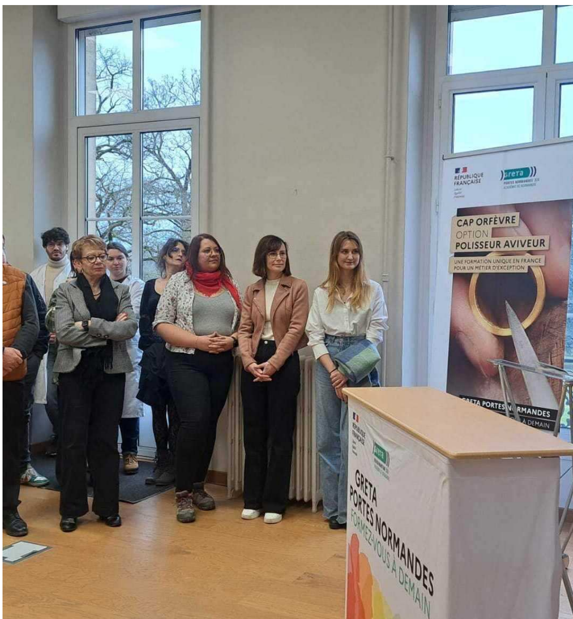
Hervé Morin est venu découvrir les deux formations liées aux métiers d'art