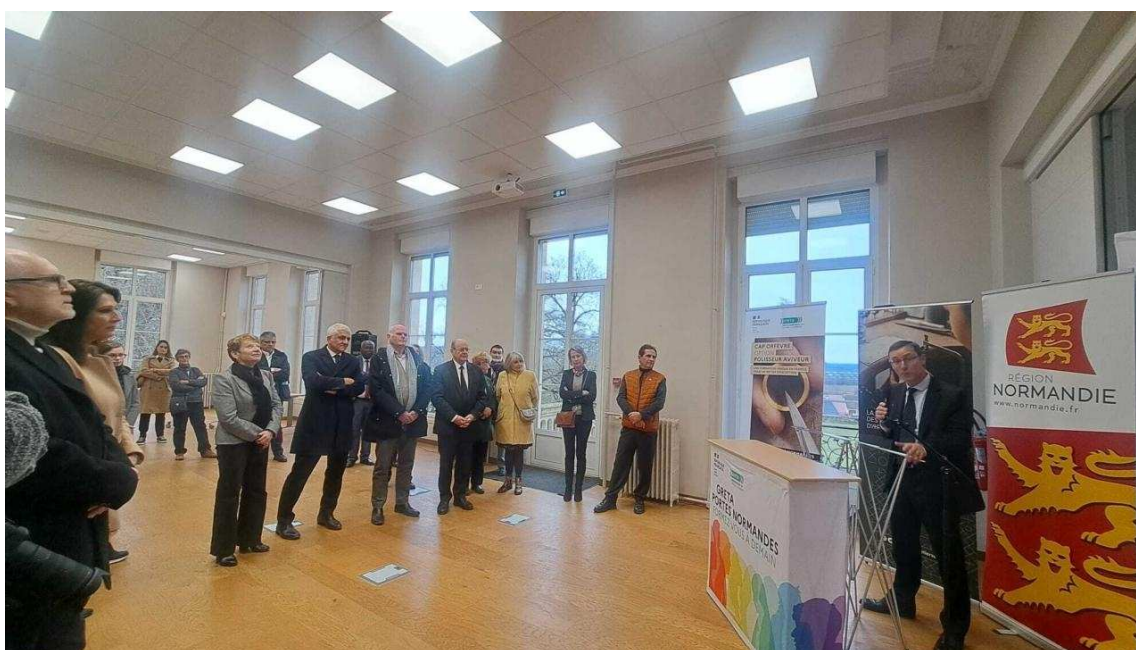
Hervé Morin est venu découvrir les deux formations liées aux métiers d'art