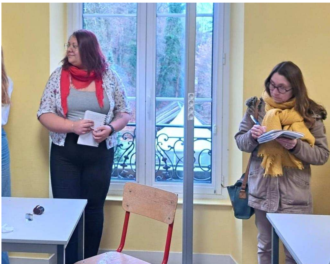
Le certificat de spécialisation Bijouterie de mode, a accueilli ses premiers apprenants vendredi 23 janvier 2026.