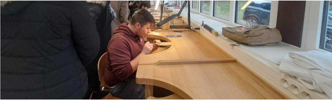
Dans l'ancienne orangerie du château, réhabilitée par l'Agglo, les apprenants en orfèvrerie