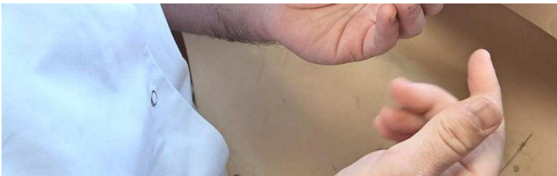
Dans l'ancienne orangerie du château, réhabilitée par l'Agglo, les apprenants en orfèvrerie | IH