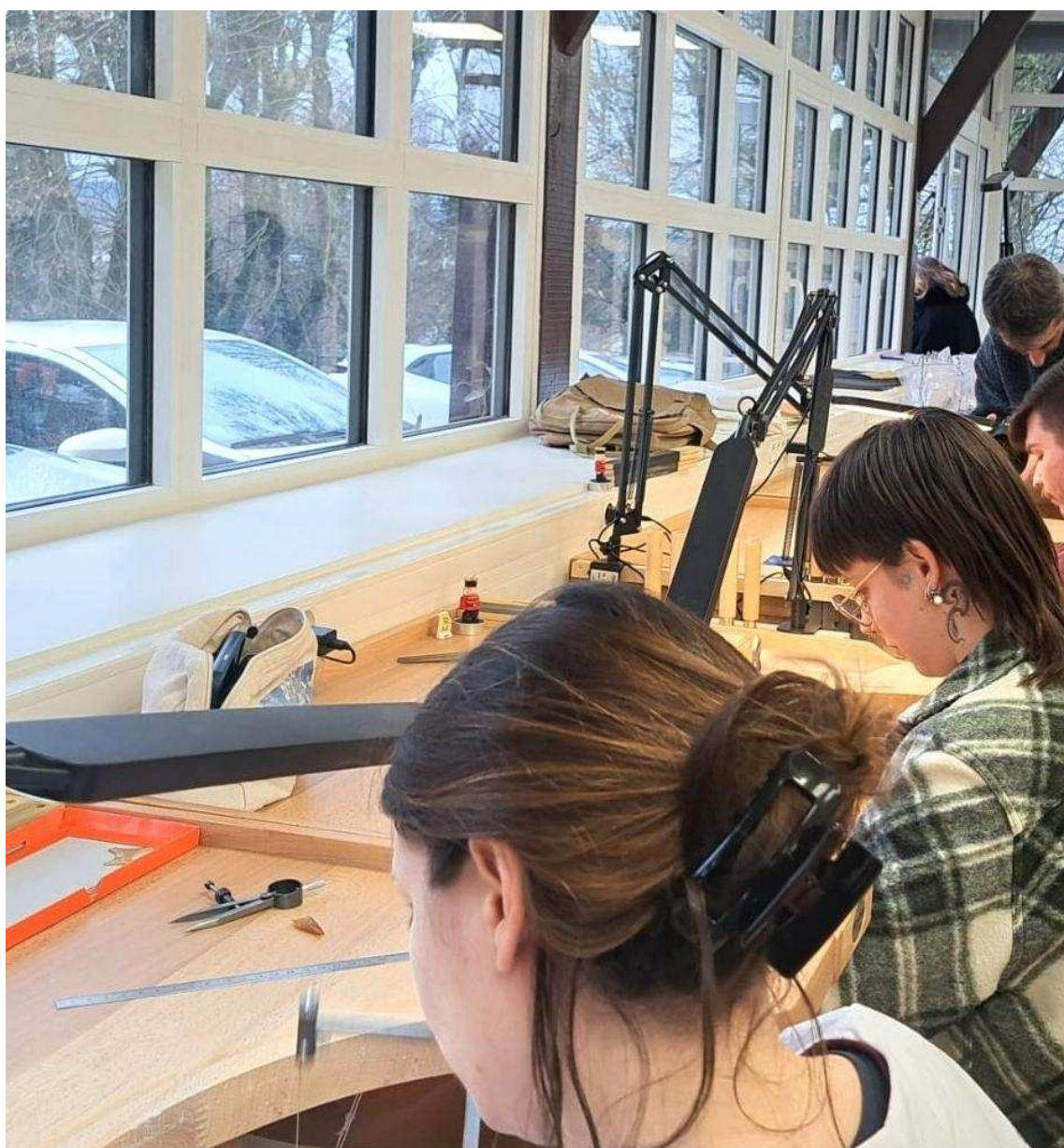
La formation d'orfèvrerie au château de Tournebut est unique en France.