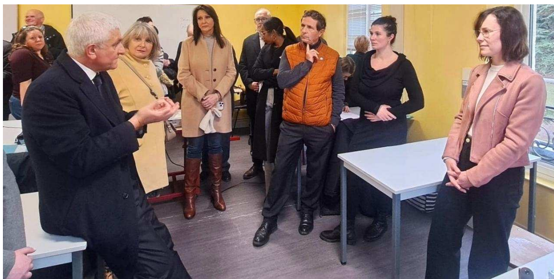
Hervé Morin est venu rencontrer les apprenants des deux formations liées aux métiers d'art qui ont ouvert à Tournebut.