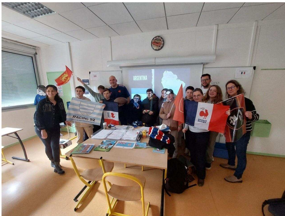
Photo souvenir avec l'entraîneur de rugby d'origine argentine.

Pendant trois heures avec trois classes, le rugbyman s'est prêté au jeu des questions-réponses dans la langue de Don Quichotte, ce qui a permis aux élèves de découvrir son parcours et son amour de l'ovale, mais aussi de parler espagnol et de faire de la géographie.