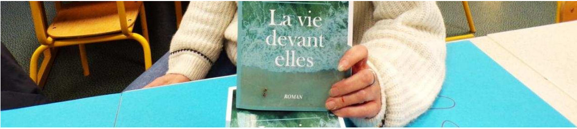
Séverine Blaise a présenté son dernier roman.