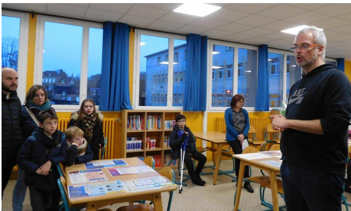
Au CDI, les élèves trouveront leur lecture préférée.