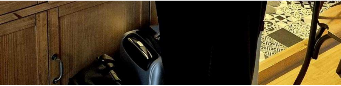
Baptiste Prioux | Baptiste Prioux