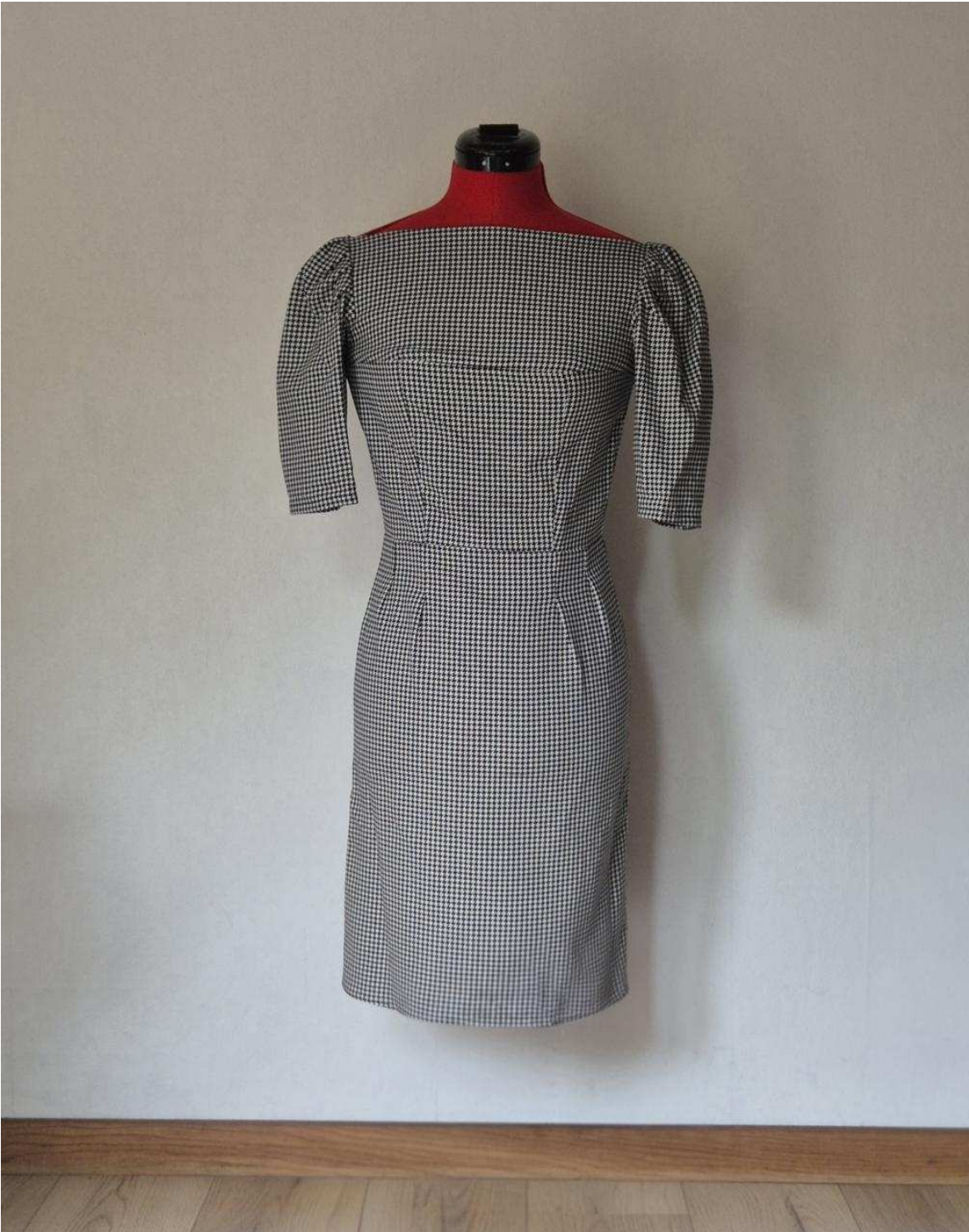
Baptiste Prioux | Baptiste Prioux