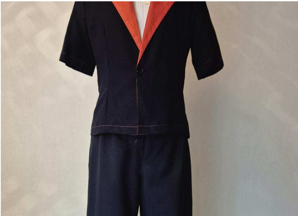
Baptiste a créé une trentaine de tenues pour ce défilé.