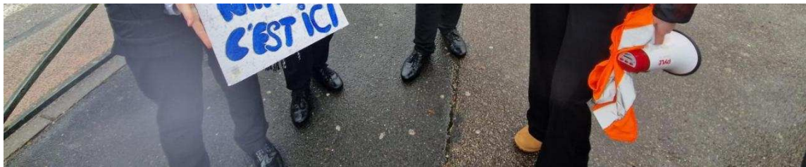
Des manifestantes sous la pluie devant le lycée Georges-Baptiste à Canteleu . | PN