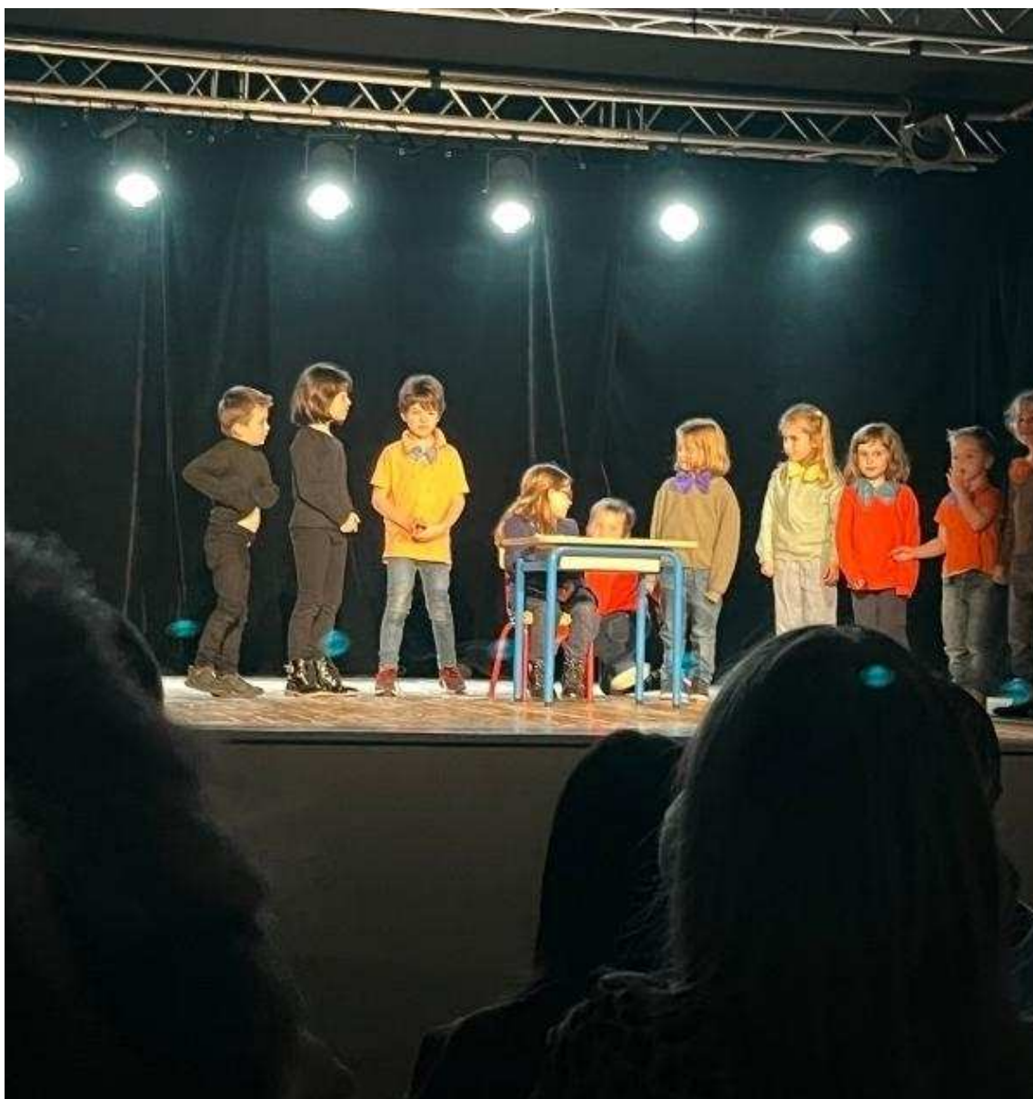
Sur scène, les élèves de les Moitiers d' Allonne ont été de vrais acteurs