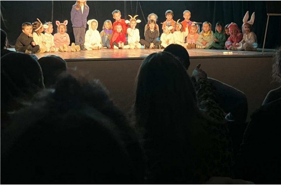
Le loup a disparu... pièce travaillé par les 82 élèves de l'école Les-Chardons-Bleus durant les ateliers théâtre