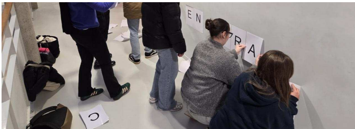
Le lycée Anguier se mobilise contre les violences envers les femmes